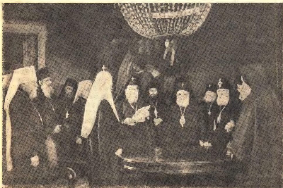
Представители автокефальных Православных Церквей Востока на приеме у Святейшего Патриарха Алексия в Московской Патриархии